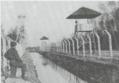
de wachttorens bij Kamp Vught

Bij de ijzeren man was de eerste slagboom daar deed een S.S-er de boom omhoog en reden we verder naar 't kamp. Daar zag ik de eerste gevangenen lopen in zebrapakjes en geheel kaal. Ik dacht eerst: dat lijkt niet best. Voor 't kamp de 2 e slagboom en daar stonden we voor de poort van het beruchte Concentratiekamp Vught.