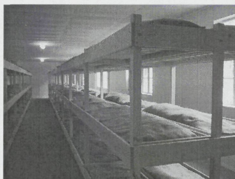
de stapelbedden: 3 hoog

De eerste nacht was ook weer een probleem. In de slaapzaal stonden ijzeren ledikanten 3 hoog en daar moesten wij op gaan liggen. 1 deken bij ieder ledikant. 't Was een vreemde gewaarwording. Alles ging in snel tempo en dan waren de bedden zo bezet. Ik kwam naast een Limburger te liggen een jongen van een goede 20 jaar, die zat voor fotograferen.